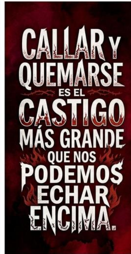
Bodas de sangre (1933)