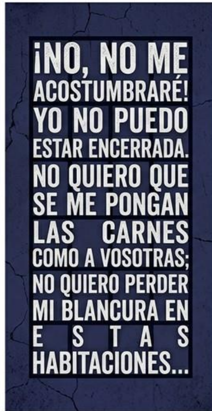
La casa de Bernarda Alba (1936)